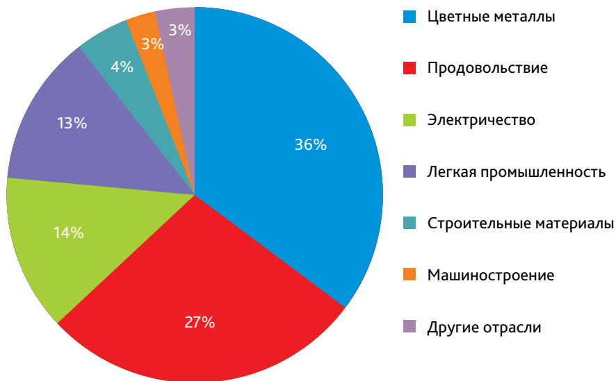
Рисунок 2. Структура объема промышленного производства Таджикистана в 2010 году